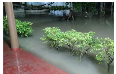
Innergården på Elim var helt översvämmad.

Det kom stora regnmängder som gjorde att man fick pumpa ut vatten både inifrån en del hus och ute på gården. Barnen hade tillsammans med personalen gjort fina små odlingar men tyvärr så blev allt förstört.